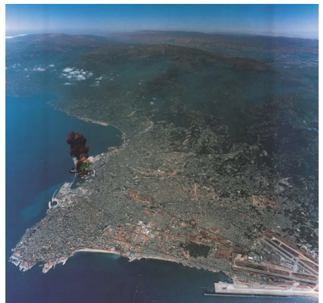
Vue aérienne Grand Beyrouth – Lieu de l'explosion