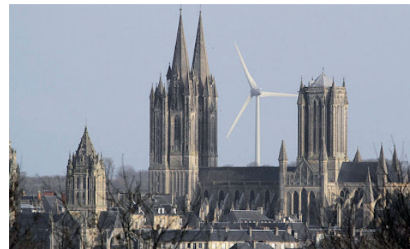
Vue d'une éolienne à 3km d'une cathédrale (Coutances- Manche)

Je suis titulaire de deux masters, le premier en contrôle organisationnel et le second en management public obtenus à l'Université de Lorraine et à l'Université de Strasbourg. J'occupe actuellement un poste au Ministère de la Transition écologique au sein d'une Direction départementale des territoires. Mes missions se concentrent sur l'application du droit des sols mais également le développement des énergies renouvelables.