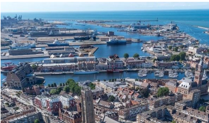
Le territoire Dunkerquois et ses objectifs de décarbonation des industries

La thèse répond aussi à un enjeu de gouvernance : abordant la causalité perçue de la pollution et les rôles que les acteurs s'attribuent dans la résolution du problème, l'enquête dégagera un axe de travail pour améliorer le dialogue territorial.