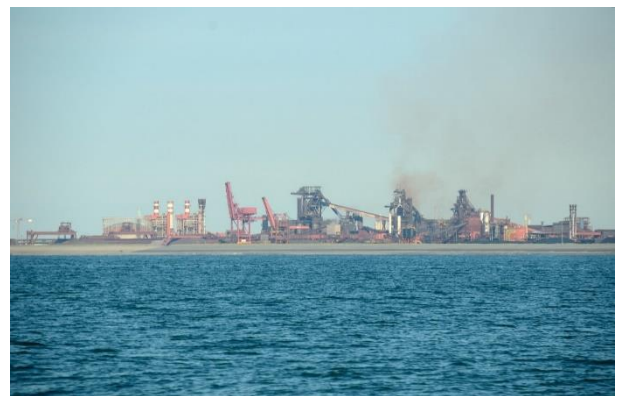
AcerlorMittal à Dunkerque témoin d'un des nombreux sites Seveso du Littoral des Hauts de Flandre

https://dunkerquepromotion.org/investissements/projets-de-decarbonation-a-dunkerque/