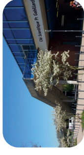
Métro cité scientifique Pr Gabillard

https://umap.openstreetmap.fr/fr/map/campus-cite-scientifi-que-698735#17/50.60937/3.14538