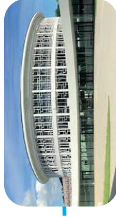
Lilliad - Learning center innovation