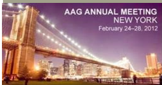
AAG ANNUAL MEETING NEW YORK February 24-28, 2012

Ces journées de présentation de travaux scientifiques et d'échanges interdisciplinaires entre membres du laboratoires, organisées plusieurs fois par an, ont pour mission de faciliter et de renforcer l'approche transversale des objets « Territoires », « Villes », « Environnement » et « Société » développée au sein et entre les deux axes de recherche de T.V.E.S.