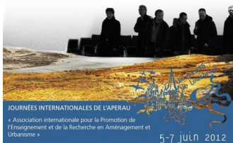
JOURNÉES INTERNATIONALES DE L'APERAU « Association internationale pour la Promotion de l'Enseignement et de la Recherche en Aménagement et Urbanisme » 5-7 juin 2012