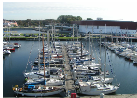
Dunkerque, port de plaisance du Bassin de la Marine.

Email : vincent.herbert@univ-littoral.fr