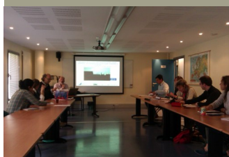
Journée du 15 juin 2012

1 : Association des Géographes Américains