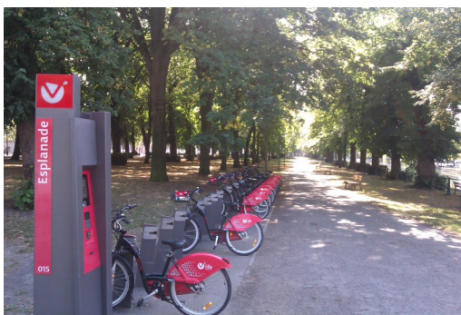
V'Lille, géré par Transpole Lille Métropole.

Lille Métropole Communauté Urbaine (LMCU)