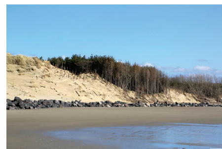
Dune avec enrochement à son pied (La Baie d'Authie - 62)